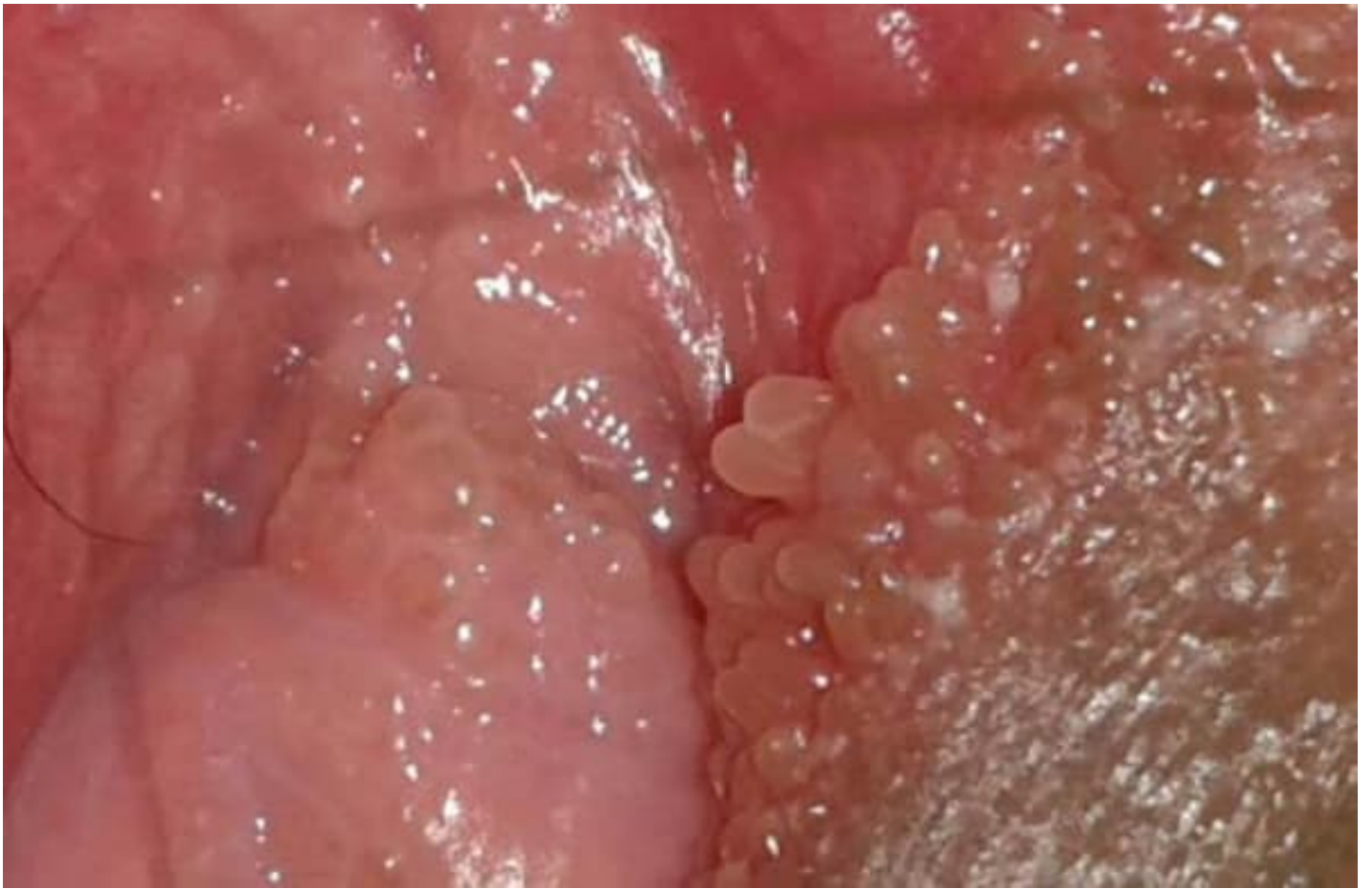
Hình ảnh nốt bệnh sùi mào gà ở trong âm đạo