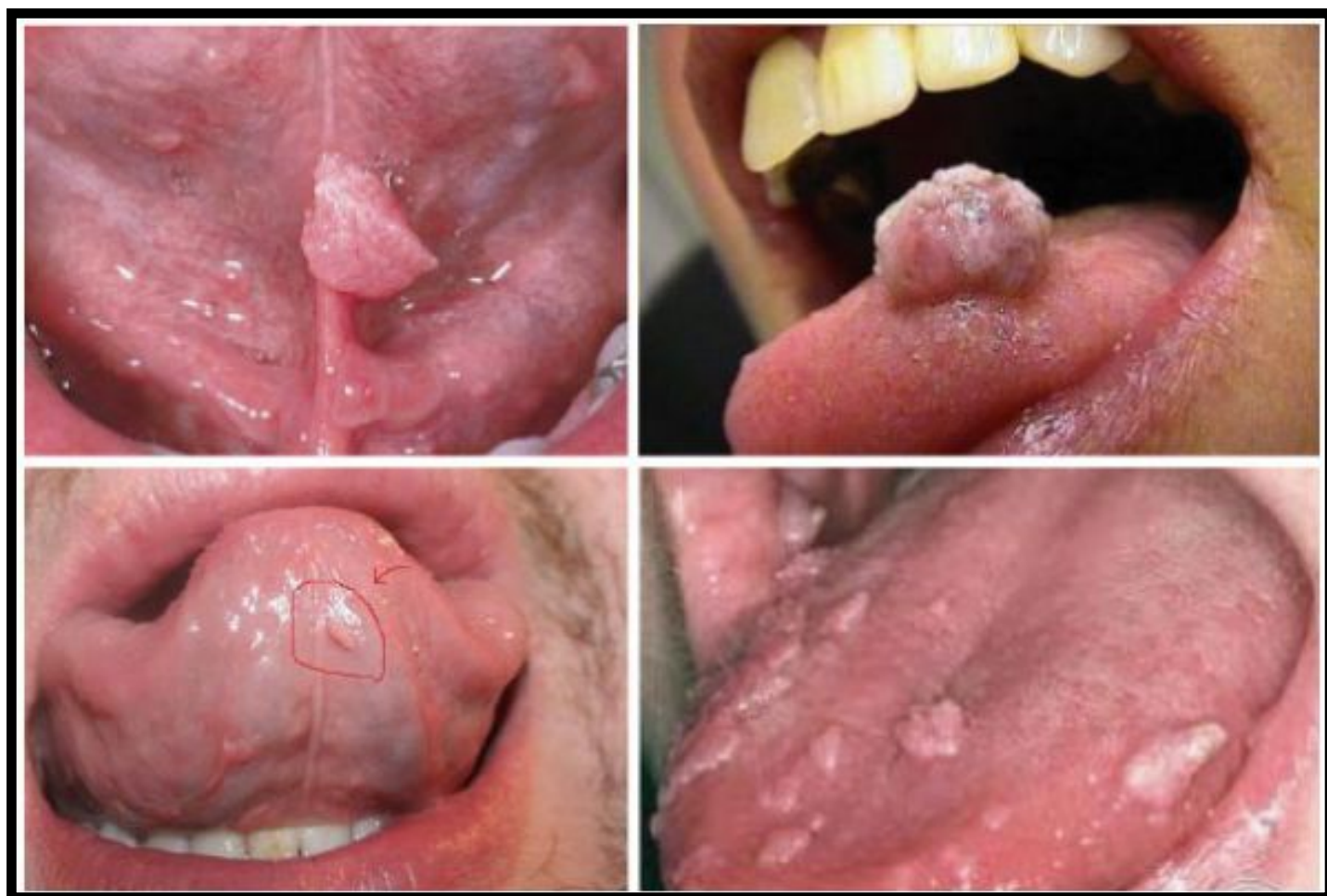
Ảnh bệnh lý sùi mào gà ở vùng lưỡi

Hình ảnh bệnh sùi mào gà ở phụ nữ (môi bé, môi lớn, âm đạo, niệu đạo, cổ tử cung,...)