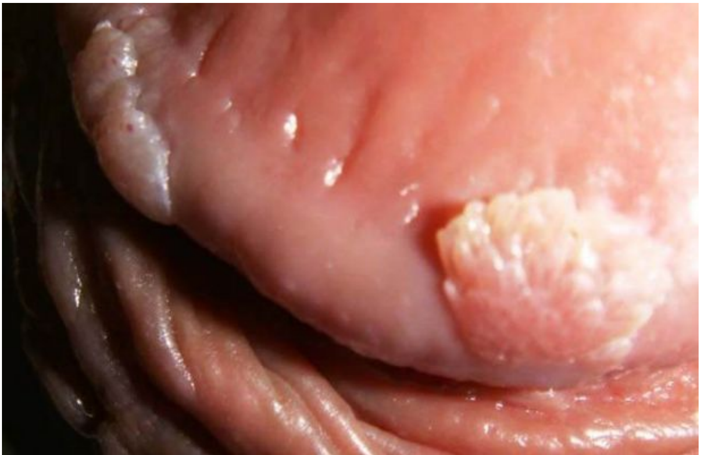
Hình ảnh bệnh sùi mào gà ở dương vật