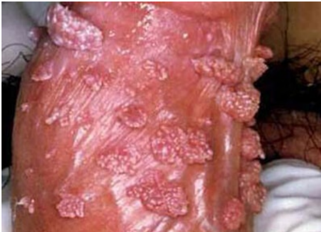
Hình ảnh sùi mào gà thời kỳ cuối tại dương vật